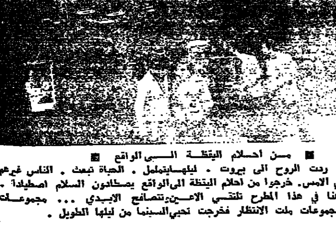
من احلام النبتة السبي الراقع . ردت الروح الى بيروت - ليلها يتامل - الحياة تمت . الناس فرح في اليس . خرجوا من احلام النبتة الى الواقع يصطادون السلام اصطيادا . هنا في هذا المرح تنقضي الاحلام وتتصالح اليبدي ... مجموعات مجموعات بلت الانتظار فخرت تحيي السنين ما ليلها الطويل .